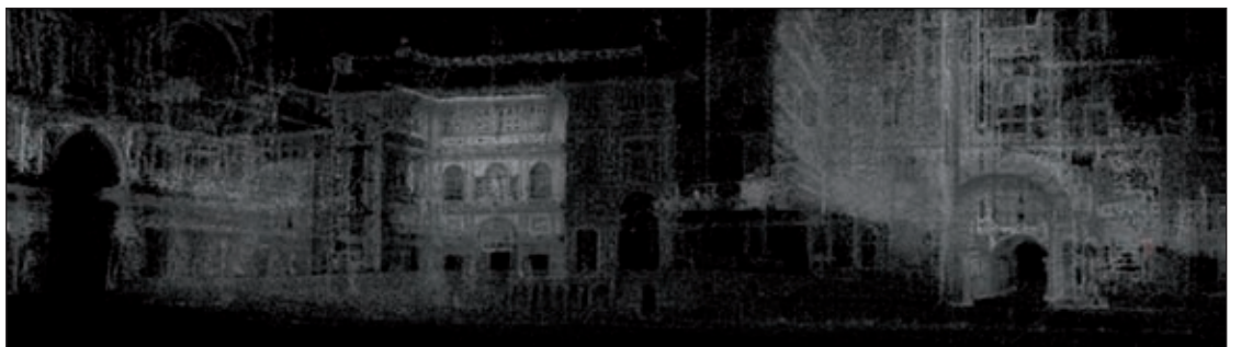
Fluid Architectures, t/m 16 augustus 2009 in het Nederlands Instituut voor Mediakunst, Keizersgracht 264, 1016 EV Amsterdam (020-6237101). Toegang € 4,50 (€ 2,50 met korting), met Museumkaart gratis.

In de expositie Fluid Architectures ontstaat een ruimte waarin het virtuele en het fysieke samen gaan: een netwerkmaatschappij die niet langer concurreert met de oude geografieën en topografieën. Deze ruimten zijn gemaakt van licht, bewegend beeld en andere media.