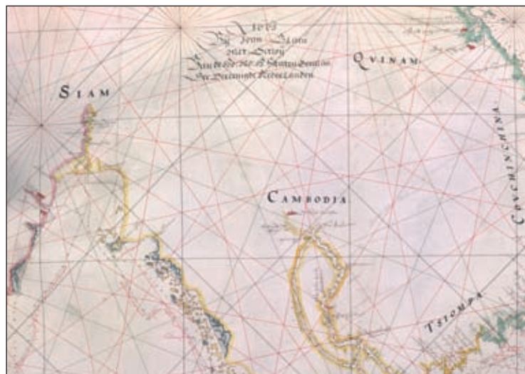
Kaart CC6 van de Golf van Siam, door Joan Blaeu, Amsterdam 1663. In 1643/1644 voeren de VOC-schepen 'Castricum' en 'Nieuwe Delft' de Golf van Siam uit. De 'Nieuwe Delft' volgde de Westkust, 'een quade coers', aldus de tekst.

Wij wensen de heer Zijdeveld veel luisterplezier!