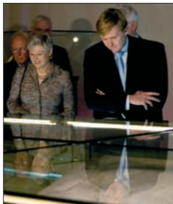
Vol belangstelling bekijkt de Prins van Oranje de eeuwenoude 'Schat van Corpus Christi' tijdens de feestelijke opening op 17 november.

Driehonderd jaar lang lagen dertig 17e eeuwse zeekaarten opgeborgen in de bibliotheek van het Corpus Christi College in Oxford. Vrijwel niemand wist van hun bestaan. Kortgeleden kwamen de eenentwintig VOC-kaarten en negen Engelse kaarten boven water. Met 2,4 miljoen euro deed het Maritiem Museum Rotterdam de grootste maritieme museale aankoop ooit. De kaarten zijn van onschatbare cultuurhistorische waarde.