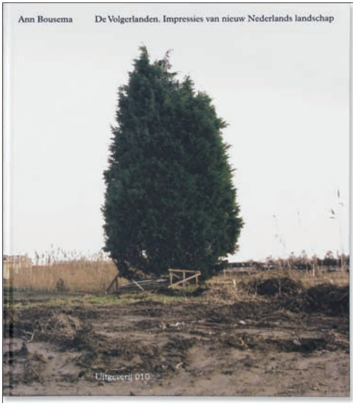
Ann Bousema De Volgerlanden. Impressies van nieuw Nederlands landschap